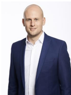
Chef de file DéFI Molenbeek Député bruxellois Conseiller communal à Molenbeek-Saint-Jean