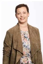
Présidente de DéFI Molenbeek-Saint-Jean Chef d'équipe au sein d'une administration communale